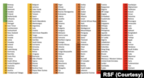
Bảng xếp hạng Tự do Báo chí 2023 của 2023.

Ông Daniel Bastard nhận định trong một tuyên bố của RSF về việc công an Hà Tĩnh bắt ông Thái: “Công an thậm chí đã không tôn trọng các quy tắc của chính họ trong việc quyết định sẽ làm gì với ông ấy. Trường hợp này là một ví dụ đáng buồn về mức độ khinh thường khủng khiếp mà chính quyền chà đạp lên sự thượng tôn pháp luật và tự do báo chí”.